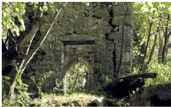
8. Ruder della chiesetta di San Canziano Razvaline cerkvice sv. Kancijana

Če krenemo s pešpoti 479, ki povezuje Mečano in Gorenji Barnas , pridemo do razvalin cerkvice sv. Kancijana . Verjetno je bila zgrajena v 15. stoletju na vrhu istoimenskega hriba na višini 723 m; dvigala se je visoko nad spodnjima dolinama Nediže in Aborne. Kot kulturni objekt je služila skupnostima obeh pobočij hriba, tu so prirejali tudi ljudske praznike na dan zavetnika; ljudje so veliko plesali in praznik se je pogosto izrodil v izgredih in prepri. Cerkvico so tudi oskrnili s krajo oltarnih relikvij, zato je cerkvena oblast leta 1935 v nji prepovedala obrede in posvetne praznike. Konec 50. let prejšnjega stoletja se je vdrla streha in usoda cerkvice je bila zapečaten. Od cerkvice so danes ostale le očarljive, z zelenjem obrasle ruševine.