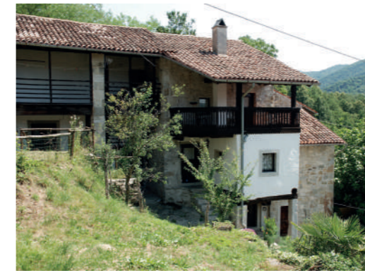
4. Sorzento / Sarženta 5. Sottovernassino / Podbarnas 6. - 7. Ponteacco / Petjag 8. Sorzento / Sarženta: chiesetta di San Nicolò / cerkvica sv. Miklauža

Il circondario di San Pietro è in larga misura pianeggiante; ciò ha evitato la massiccia emigrazione che interessa altri comuni delle Valli, determinando negli anni la costruzione di numerosi nuovi insediamenti abitativi e produttivi che hanno infittito inevitabilmente sull'immagine attuale dei paesi. Oltre alle mutate condizioni economiche e sociali, anche il terremoto del 1976, che ha duramente colpito alcune frazioni del Comune, ha contribuito a questa trasformazione. D'altro canto, il sisma ha comportato una maggiore attenzione nel recupero di alcuni edifici particolarmente significativi, che per fortuna si sono conservati a testimoniare la tecnica costruttiva dei contadini valligiani. Il sapiente uso funzionale dei materiali reperiti sul luogo, come la pietra, il legno e il laterizio, fa di questi edifici una fonte imprescindibile per lo studio della cultura materiale delle Valli del Natisono. Di particolare interesse, alcuni edifici ben restaurati a Ponteacco e l'articolato complesso abitativo, risalente al XVIII secolo, di Sottovernassino. Merita una visita la borgata di Sorzento, che si caratterizza per una serie di agglomerati disposti a corte e presenta una tipologia insediativa pressoché unica nelle Valli del Natisono. I cortili erano di pertinenza comune a una o più famiglie, e vi si accedeva da un ampio portone. Una breve passeggiata conduce alla chiesetta di San Nicolò, edificata su un'altura che sovrasta il paese.