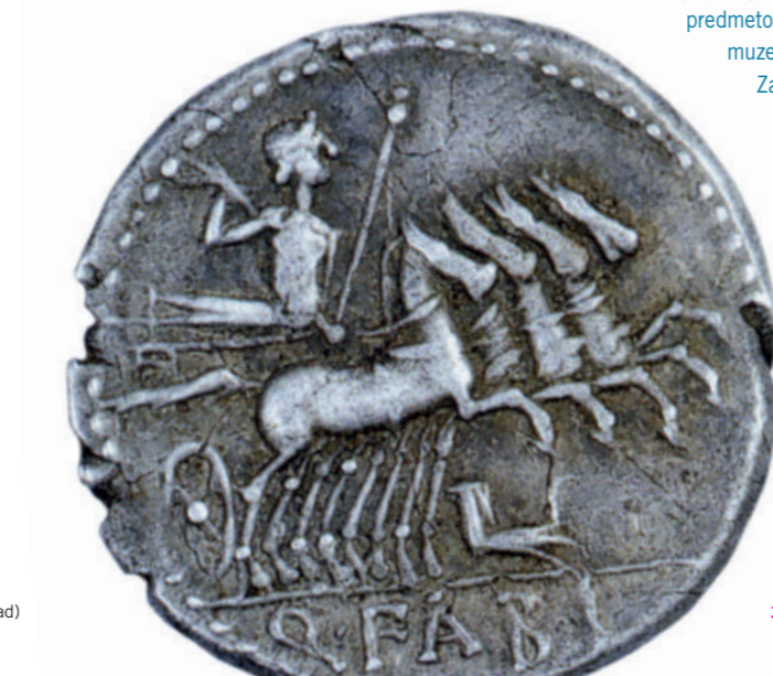
1. - 2. Biarzo / Bjarcj: il Riparo e il vecchio mulino Jama par Malne in stari mljn 3. Moneta romana in argento rinvenuta sul M. Barda Rimski srebrenik na gori Barda (Museo Archeologico Nazionale di Cividale / Narodni arheološki muzej, Čedad)

Za ozemlje špetske občine so značilni skromna nadmorska višina, obilno vodovje in rodovitna zemljišča. Omenjeni naravni pogoji in številne naravne jame so že iz prazgodovinskih časov spodbujali naseljevanje. Poleg tega je to ozemlje že v antičnih časih odigralo pomembno strateško vlogo, saj predstavlja pomemben dostop v Soško dolino.